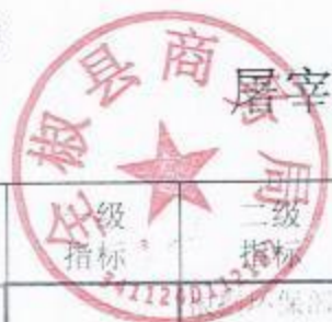
屠宰场污水处理设置建设专项经费项目绩效评价评分情况表